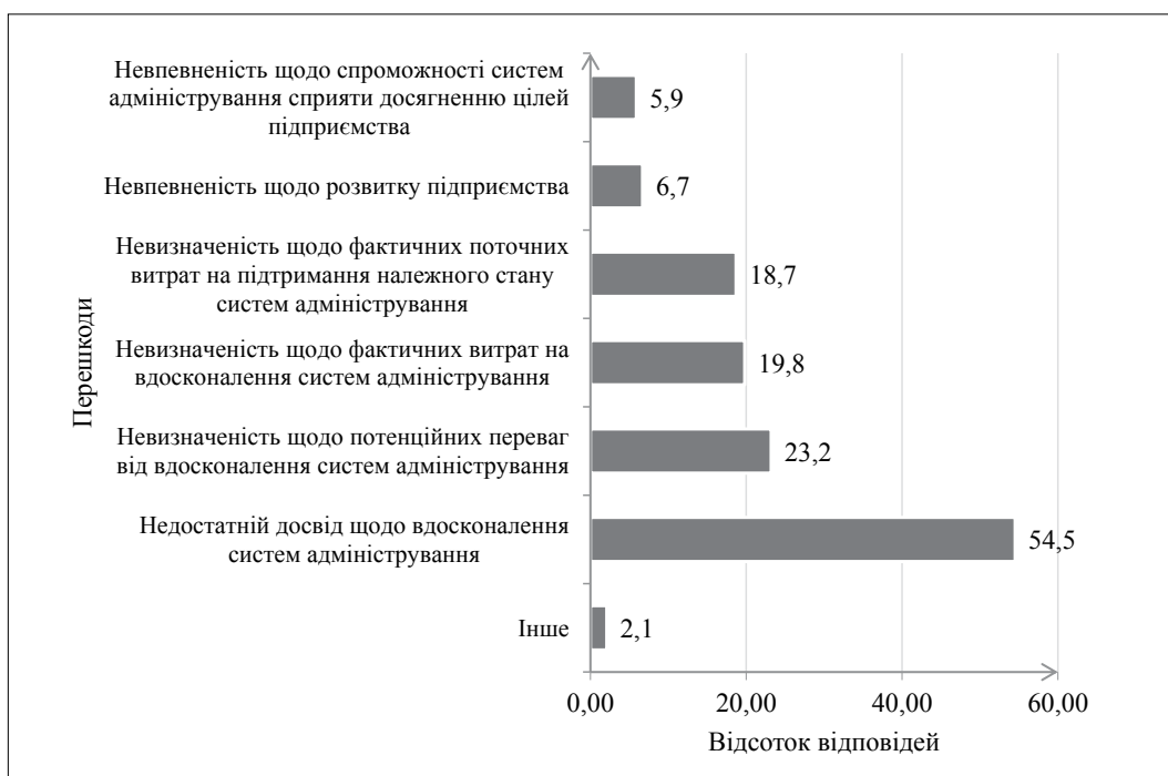
Рис. 3. Основні перешкоди щодо ухвалення рішень про вдосконалення систем адміністрування в управлінні підприємствами з урахуванням євроінтеграційних процесів