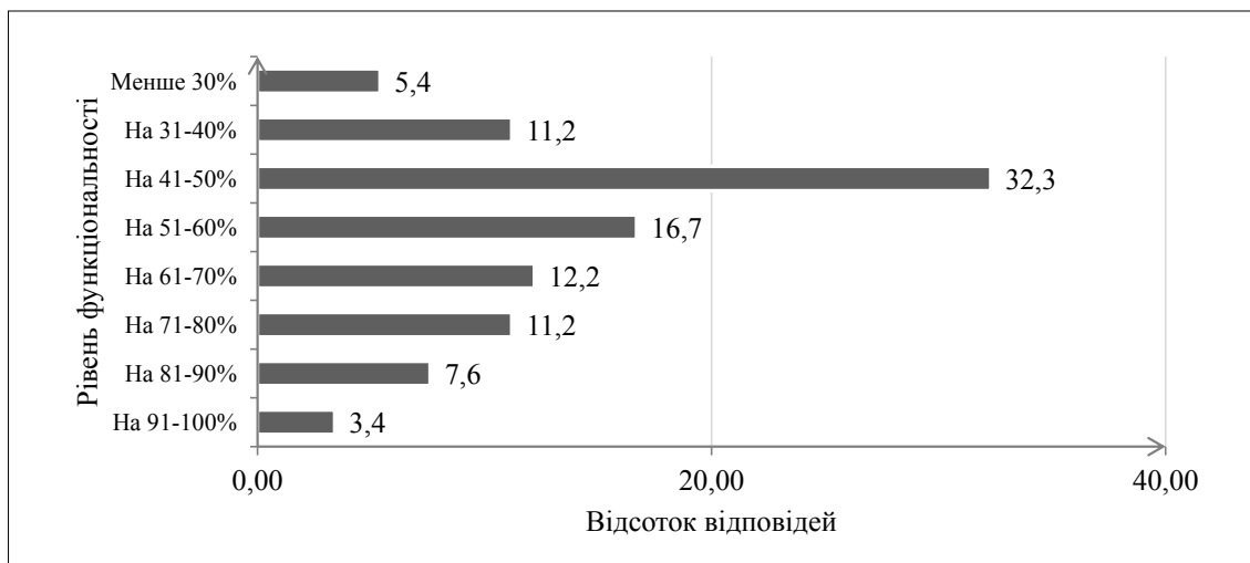
Рис. 6. Рівень функціональності систем адміністрування в управлінні підприємствами