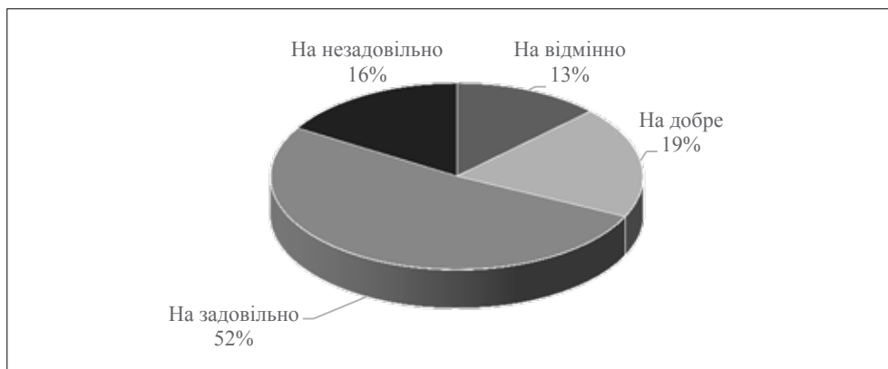
Рис. 1. Рівень розуміння систем адміністрування працівниками вітчизняних підприємств

За результатами проведеного опитування з'ясовано також те, що з-поміж ключових перешкод щодо ухвалення рішень про вдосконалення систем адміністрування в управлінні підприємствами основною все ж таки є недостатній досвід у цьому напрямі. Про це, зокрема, сказали у своїх відповідях 54,5% респонден-