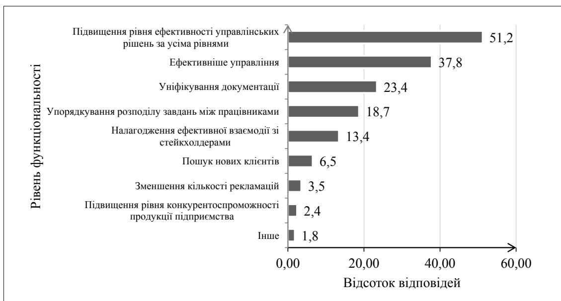
Рис. 5. Основні переваги використання систем адміністрування в управлінні підприємствами

Висновки. Таким чином, діагностовано ключові параметри стану систем адміністрування на вітчизняних підприємствах (рівень розуміння систем адміністрування працівниками компаній, рівень компетентності посадових осіб щодо побудови та використання таких систем, основні перешкоди щодо ухвалення рішень про вдосконалення систем адміністрування, пріоритетні напрями діяльності суб'єктів господа-