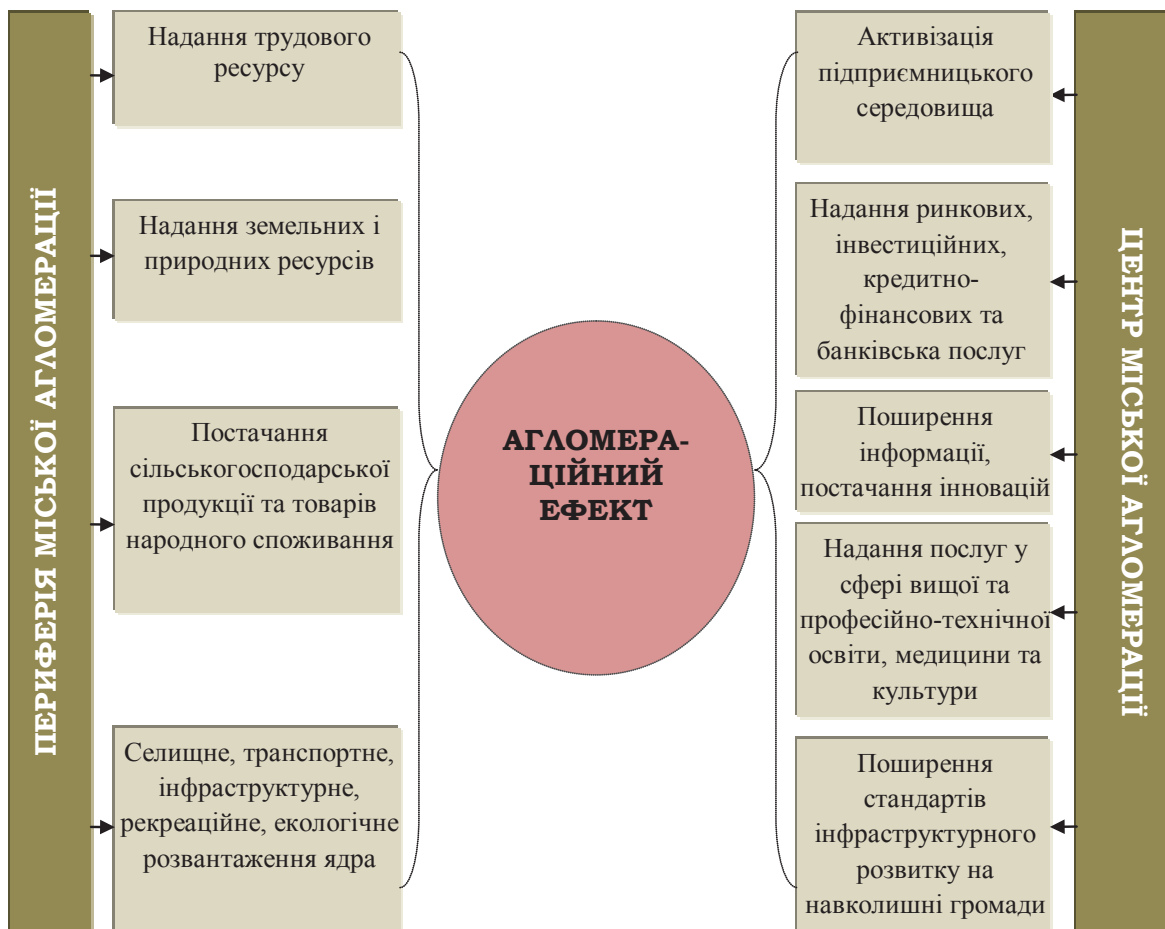
Рис. 1. Агломераційний ефект взаємодії центру та периферії міської агломерації

Досліджуючи особливості формування та функціонування міських агломерацій, слід зауважити виникнення феномену агломераційного ефекту території (рис. 1), суть якого полягає у створенні додаткових конкурентних переваг та стрімкому соціально-економічному розвитку