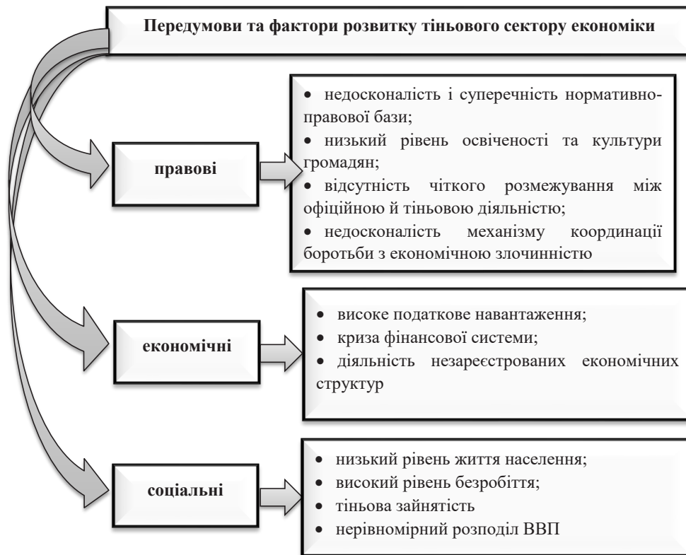
Рис. 1. Класифікація передумов та факторів розвитку тіньового сектору економіки