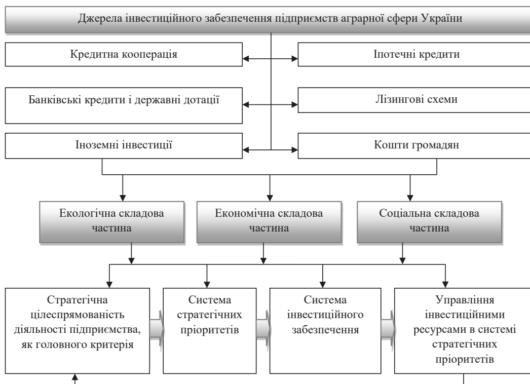
Рис. 2. Джерела інвестиційного забезпечення підприємств аграрної сфери України

Водночас погіршення інвестиційного клімату загалом в економіці України привело до суттєвого скорочення інвестиційної активності в аграрному секторі економіки України. Загальне зниження інвестиційної активності в аграрному секторі супроводжувалося відновленням орієнтації підприємств аграрного сектору економіки перш за все на погашення своїх боргів