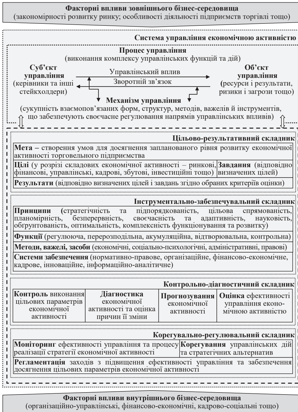
Рис. 2. Функціональна модель механізму управління економічною активністю підприємств торгівлі

Архітектуру розробленої функціональної моделі механізму управління економічною активністю підприємств торгівлі представлено чотирма складниками: