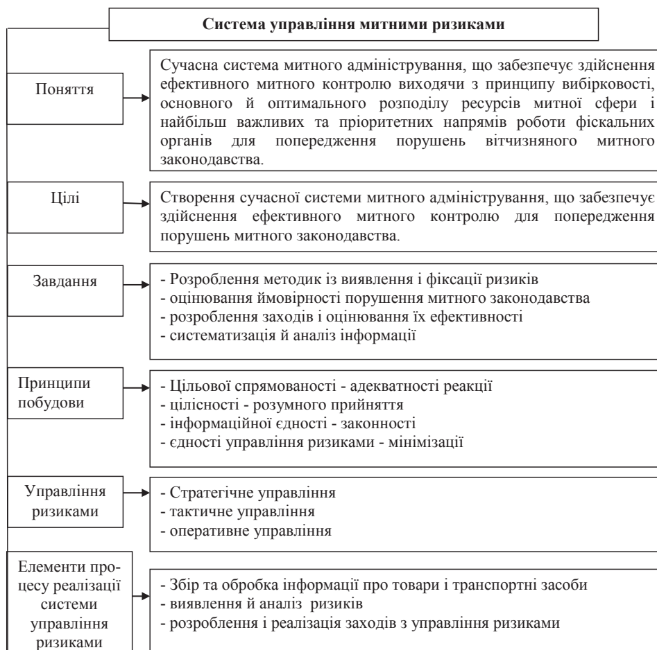
Рис. 2. Система управління митними ризиками

Система управління ризиками містить суб'єкти й об'єкти управління. Суб'єктами управління є посадові особи митних підрозділів, що здійснюють вплив на об'єкт митного управління. Об'єктом управління виступає безпосередній ризик, поєднаний із виконанням митних операцій.