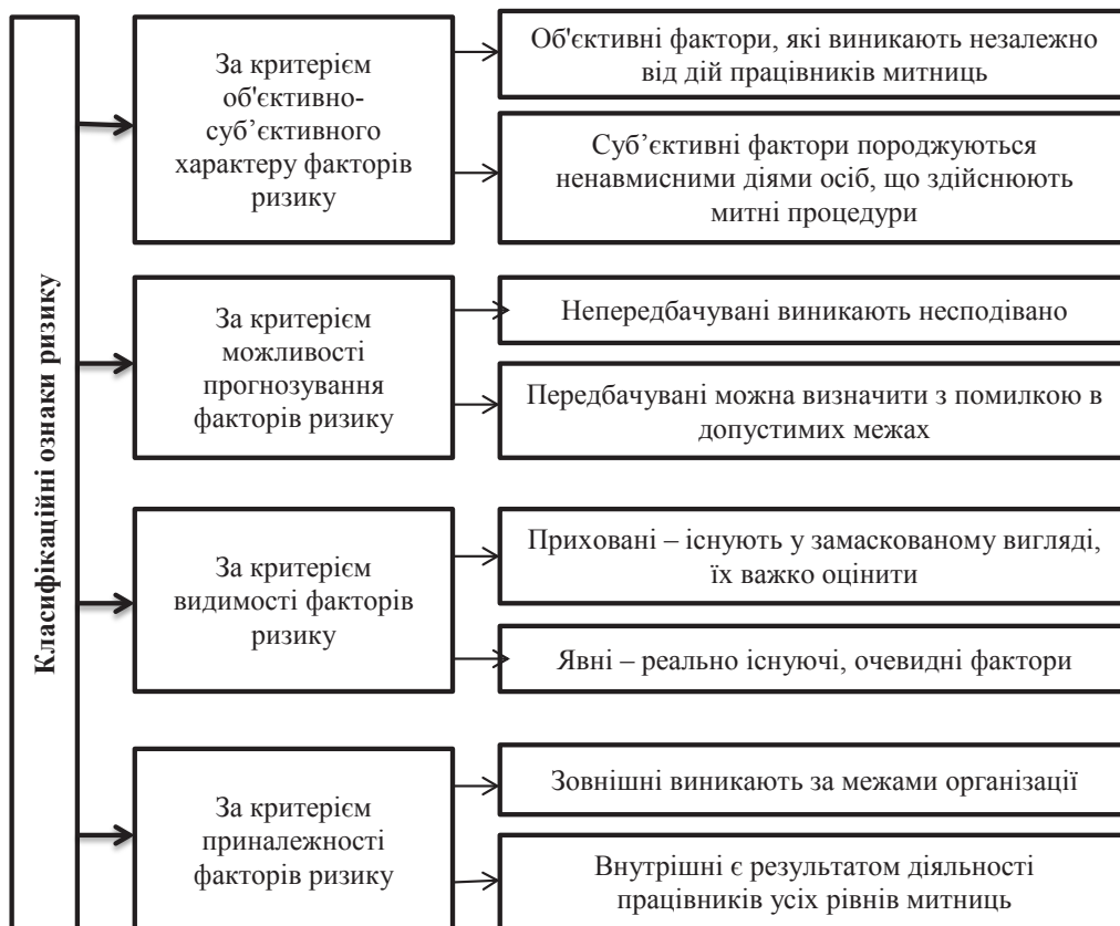
Рис. 3. Класифікаційні ознаки ризику

Перспектива мінімізації ризиків та прогнозування імовірності виникнення характеризується системою класифікації, яка здійснює функцію алгоритму, на підставі якого створюються й розробляються системи управління митними ризиками, формуються заходи та інструменти щодо зменшення негативного впливу. Класифікація ризику дає змогу чітко характеризувати місце кожного виду в цілій системі. Здійснений аналіз класифікації ризиків дав змогу виявити причини, які зумовлюють відсутність однієї думки щодо систематизації мит-