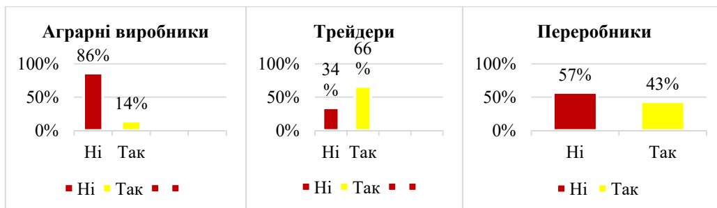
Рис. 2. Усвідомлення поняття хеджування ризиків учасниками ланцюга реалізації аграрної продукції в Україні

Сільськогосподарські виробники звертаються до інструменту хеджування у різних ситуаціях. Зокрема існує поняття «хеджування сховищ», коли фермери захищають себе від зниження ціни на товар, який зберігається у сховищах, шляхом «короткого» хеджування. Для цього ф'ючерсні контракти продаються як тільки урожай потрапляє у сховища, завдяки чому вартість товару зберігається відповідно до очікувань товаровиробника. Також аналогічним чином використовується «хеджування виробництва». У будь-якому випадку втрати можливих більших прибутків при збільшенні ринкових цін компенсуються можливими збитками при падінні ринкових цін. «Довге» хеджування вико-