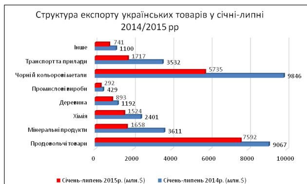
Рис. 1. Структура експорту українських товарів у січні-липні 2014–2015 рр.

експорту товарів до країн ЄС у січні-липні 2015 р. склав 7 млрд 156,3 млн дол., або 33,0% від загального обсягу експорту, і зменшився порівняно з аналогічним періодом 2014 р. на 33,9%.