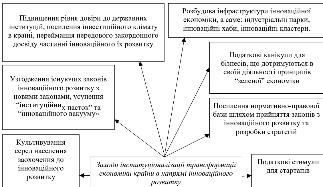
Рис. 4. Шляхи і заходи інституціоналізації трансформації національної економіки в напрямі її інновацізації та сталого розвитку

Не останню роль у відновленні довоєнного інноваційного розвитку відводимо інституту довіри до державних інституцій та міжособистісної довіри у веденні інноваційного бізнесу. Та довіру потрібно культивувати тривалою дією норм, дотриманням правил, якісними законами, які працюють і не мають подвійного прочитання. Уряд повинен культивувати підтримку застосунку цифрових технологій для якісної структурної трансфор-