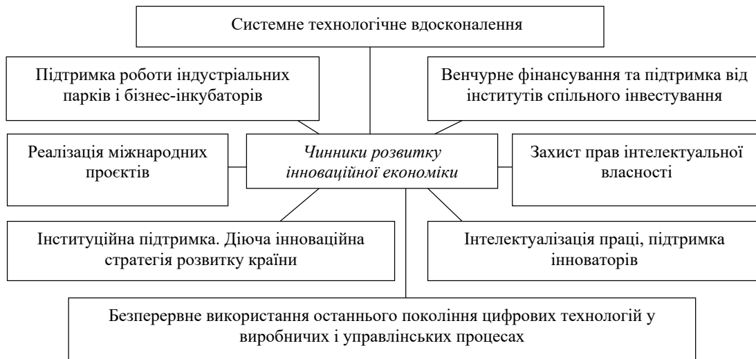
Рис. 1. Детермінанти інноваційного розвитку національної економіки

Простежується тісний взаємозв'язок і взаємозалежність між інституційним розвитком країни, цифровою трансформацією, системною модернізацією виробництва й інноватизацією економіки (рис. 2). Автоматизація і цифровізація, що націлені на прозору діяльність бізнесу та ефективне управління процесами проєктують становлення нової моделі інноваційно-цифрового розвитку країни. Інституційний вплив відчуває і соціально-економічна система. Відбувається він шляхом формування нових соціальних інститутів, інститутів інноваційного й цифрового розвитку, інститутів воєнної відбудови. Оптимізація бізнес-процесів за рахунок використання нового покоління цифрових інструментів дозволяє докорінно змінити, комплексно трансфор-