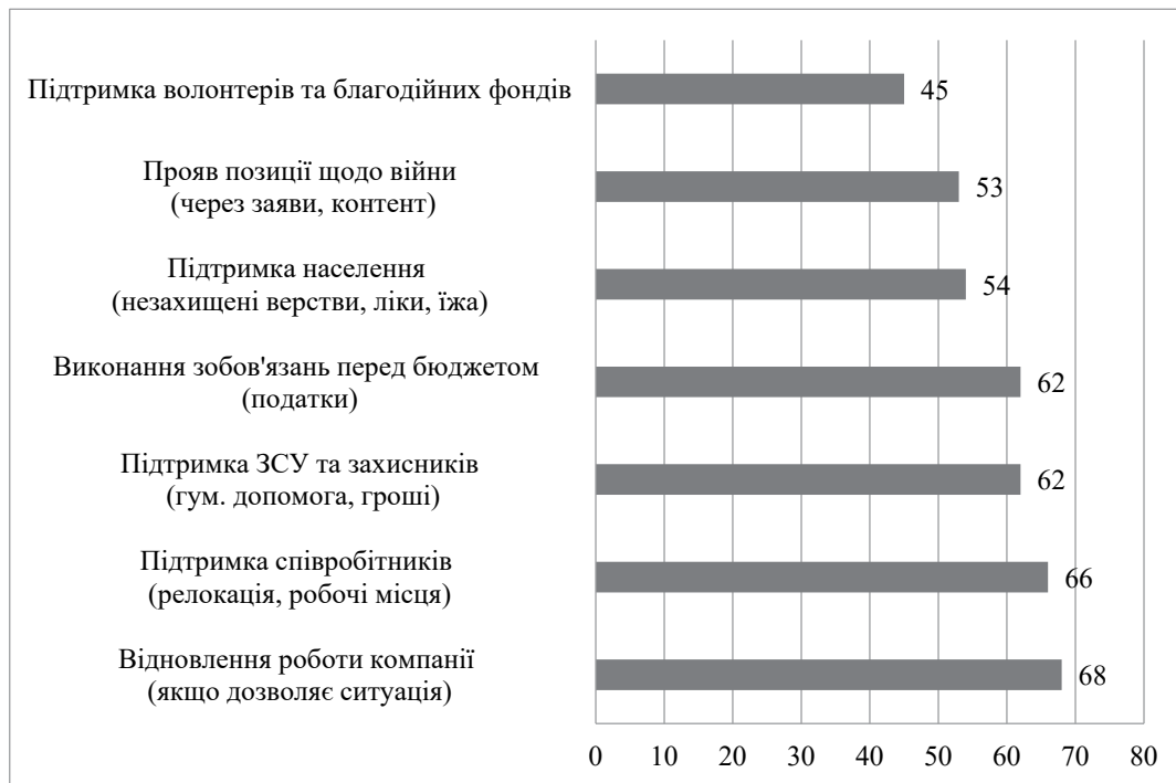
Рис. 2. Частка населення, яка вважає надзвичайно важливим, щоб компанія підтримувала різні соціальні ініціативи, %

Корпоративна соціальна відповідальність виступає ефективним механізмом трансформації поведінкових стратегій домогосподарств, що перебувають у стані