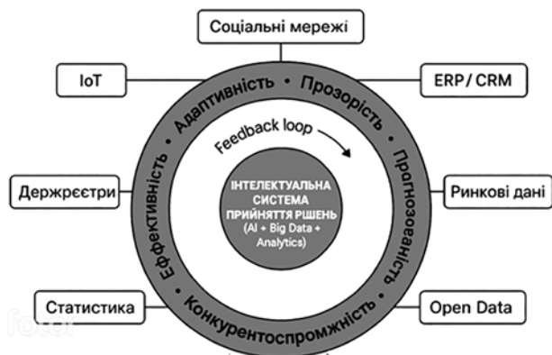
Рис. 2. Цифрова екосистема інтеграції даних у процесі прийняття управлінських рішень