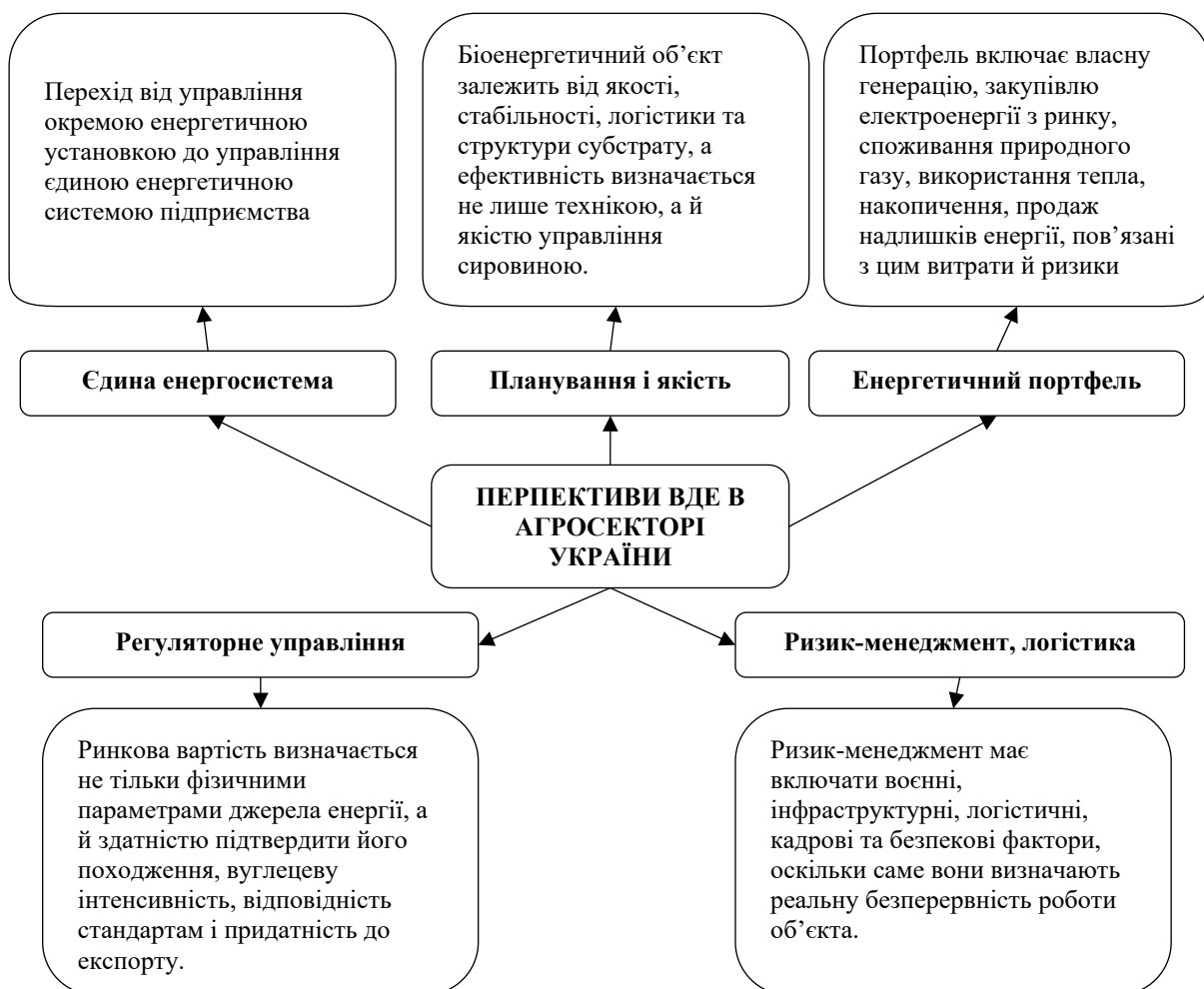
Рис. 2. Систематизація перспективних напрямків розвитку відновлювальних джерел енергії в агросекторі України

Усі п'ять блоків слід розглядати як взаємопов'язану систему, а не як окремі напрями. Технологічна інтеграція без належного сировинного планування не забезпечить стабільного завантаження установки, а економічне